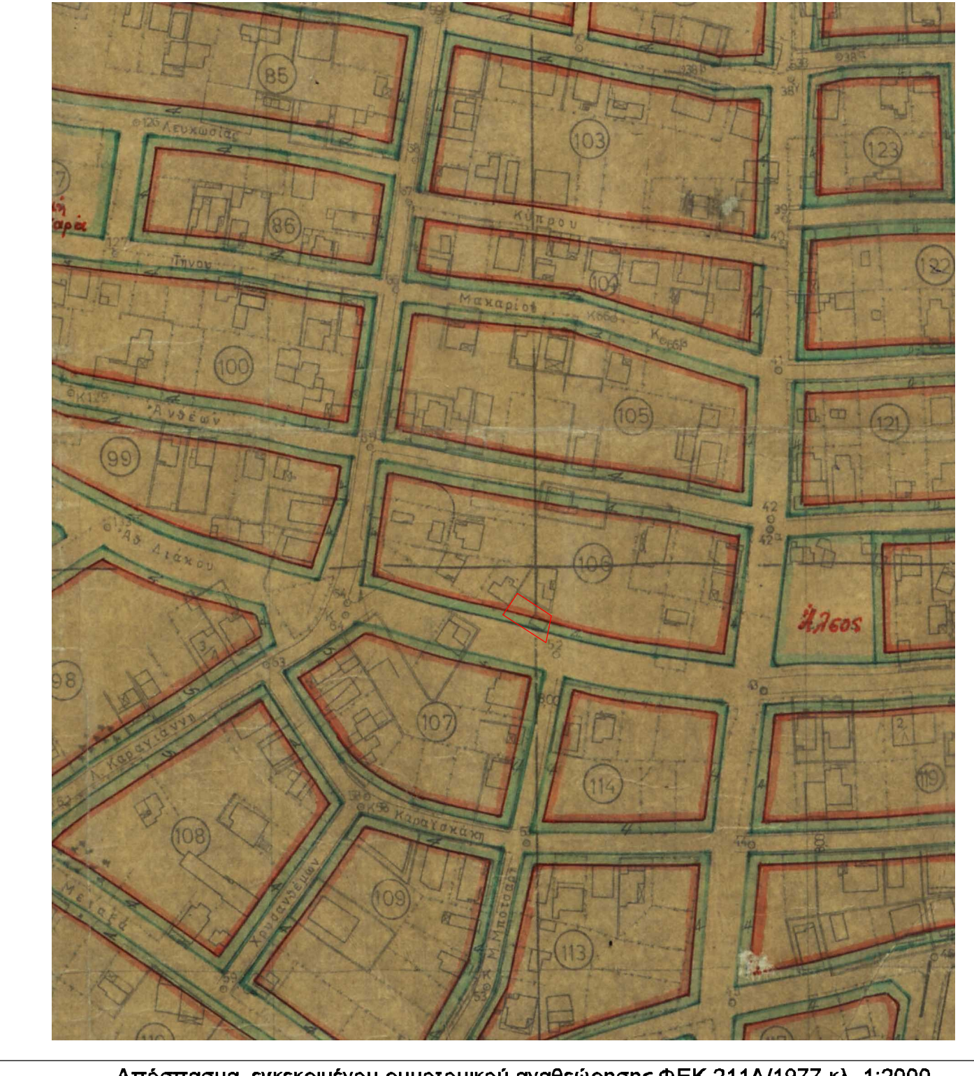
Απόσπασμα εγκεκριμένου ρυμοτομικού αναθεώρησης ΦΕΚ 211Δ/1977 κλ. 1:2000

ΔΙΑΤΑΓΜΑΤΑ - ΟΡΟΙ ΔΟΜΗΣΗΣ Δ/γμα ρυμοτομίας: ΦΕΚ 211Δ/1977 Έγκριση ΓΠΣ: ΦΕΚ 194Δ/28-3-24 ΤΟΜΕΑΣ II Ελάχιστο εμβαδόν κατά κανόνα: 400 τ.μ. Ελάχιστο πρόσωπο κατά κανόνα: 15 μ. Ημερομηνία παρέκλισης: προ 9/6/1973 Εμβαδό κατά παρέκλιση: 400 τ.μ. Πρόσωπο κατά παρέκλιση: 13 μ. Ημερομηνία παρέκλισης: προ 21/9/1970 Εμβαδό κατά παρέκλιση: 200 τ.μ. Πρόσωπο κατά παρέκλιση: 12 μ. Συντελεστής δόμησης: 0.8 Κάλυψη: 0.4 Ύψος: 11.00 μ. + 1.50 μ. για στέγη (ΦΕΚ 104Δ/01) Γραφείο: Π.0 111/04 (ΦΕΚ 76Α/04) Χρήσεις: ΦΕΚ 211Δ/1977 Απαγορεύονται βιοτεχνίες, βιομηχανίες και αποθήκες Έγκριση Αρχαιολογίας (έλεγχος καταβολής): ΥΠΠΟΑ/ΓΔΑ/Κ/ΒΕΠΚΑ/198315/106543/8314/24-10-2013) Το ακίνητο οφείλει 10% εισφορά σύμφωνα με το αρ. 20 του Ν.2508/87. Η εισφορά μετά την τροποποίηση υπολογίζεται (Α-Τ2-α'-Α): 7,80μ και θα καλυφθεί από μελλοντική πράξη αναλογισμού. Υπολειπόμενος οφειλόμενος εισφοράς ιδιοκτησίας (αρ.20 του Ν2508/87): Ε.Α. = 19,22 Χ 0,10 = 1,922 = 0,99 τ.μ.